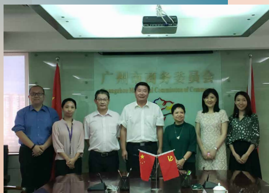
Visita à Comissão Comercial de Guangzhou

Com vista a concretizar as construções da Grande Baía Guangdong-Hong Kong-Macau e promover a participação nos respectivos trabalhos, bem como para intensificar a cooperação e intercâmbio entre a Direcção dos Serviços de Economia e as entidades locais da Grande Baía responsáveis pelos assuntos comerciais, a comitiva da DSE efectuou uma visita a nove cidades da Grande Baía Guangdong-Hong Kong-Macau, tendo encontros com os dirigentes das referidas entidades e realizando visitas às empresas localmente instaladas de capitais de Macau e parque industrial de alta tecnologia.