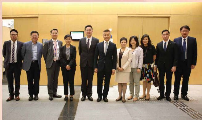
Foto do “Grupo de trabalho para a promoção da cooperação económica entre Hongkong e Macau” e dos representantes que participaram na reunião

kong e Macau, as duas partes irão, em conformidade com os planos de cooperação económica e técnica no âmbito do “Acordo CEPA Hongkong-Macau”, desenvolver a cooperação no domínio da transparência da legislação e das barreiras técnicas ao comércio.