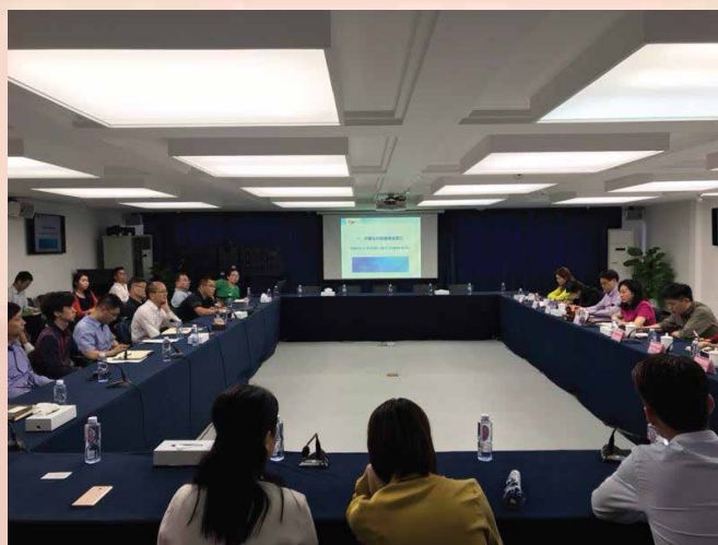
A Sessão de Promoção do Fundo de Cooperação e Desenvolvimento China – Países de Língua Portuguesa

gestão, etc. Durante a sessão de discussão, os representantes participantes salientaram que o Fundo de Cooperação e Desenvolvimento China – Países de Língua Portuguesa vai trazer novas oportunidades às empresas de Qianhai (Shenzhen), e a equipa de gestão pode prestar apoio nas experiências do exercício das actividades e rede de informações, o que contribui para procura de projectos de investimento adequados.