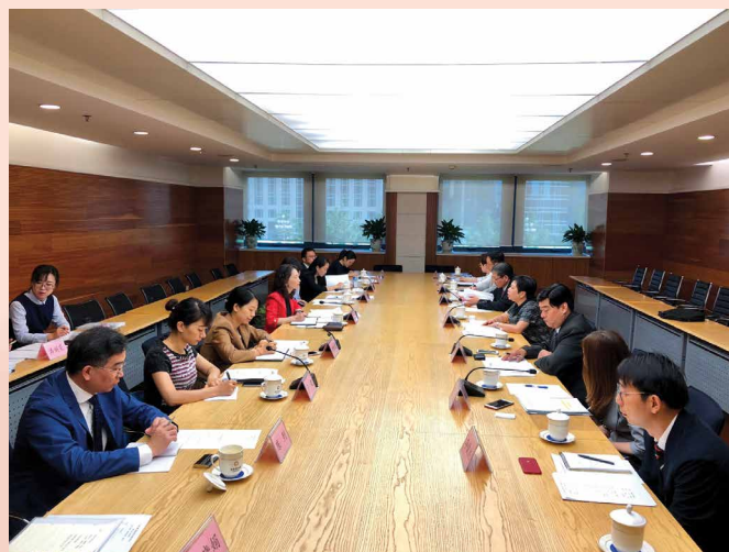
Reunião do grupo de trabalho da facilitação do comércio de mercadorias no âmbito do CEPA

Interior da China as reivindicações sobre facilitação alfandegário conforme a necessidade prática dos sectores empresariais de Macau, e as duas partes trocaram ideias e tiveram plena comunicação em relação aos temas como a facilitação alfandegário, quarentena e inspecção e procedimentos alfandegários.