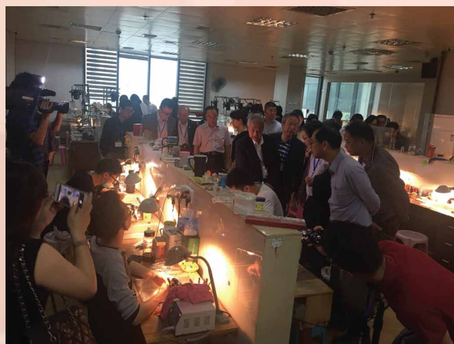
Visitou processo de transformação como o talhe e polimento na esmeralda de alta qualidade

disso, a mesma também visitou uma associação comercial de jóias e jades de Jieyang, tendo trocado opiniões com cerca de 30 representantes das empresas locais em matéria da evolução do sector da ourivesaria e joalheria dos dois lados, e abordado, em conjunto, o tema sobre a fusão entre o design e artesanato de Jieyang e o maduro mercado internacional de consumo de bens turísticos de Macau, contribuindo para estabelecer uma relação de cooperação com benefícios e ganhos mútuos.