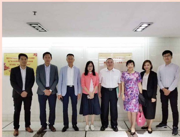
Fotografia dos representantes que participaram nesta ocasião