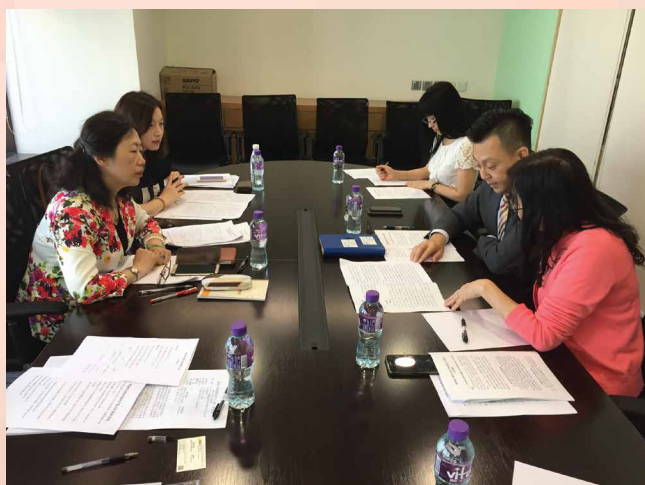
Reunião de Trabalho para Impulsão da Propriedade Intelectual na Grande Baía Guangdong-Hong Kong-Macau

No intuito de promover o desenvolvimento colaborativo da área de propriedade intelectual na Grande Baía Guangdong-Hong Kong-Macau, reforçando a criação, uso e protecção da propriedade intelectual na Grande Baía, os representantes do Departamento dos Direitos de Propriedade Intelectual da