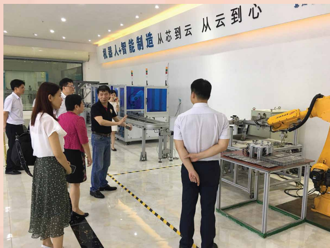
Visita à indústria da tecnologia das cidades da Grande Baía

plenamente as vantagens de “Um Centro, Uma Plataforma”, promoverá a melhoria da facilitação do comércio e investimento em articulação com a do Interior da China, de modo a disponibilizar mais oportunidades de desenvolvimento às empresas dos dois territórios e acelerar a integração de Macau no desenvolvimento da Grande Baía.