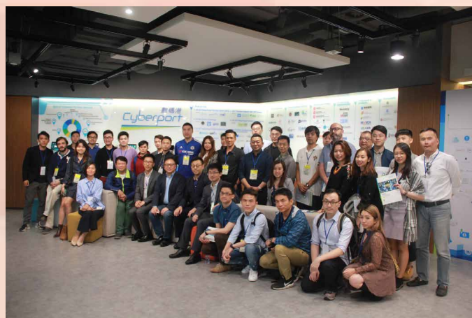
O Cyberport de HongKong foi o terminal da viagem da delegação do intercâmbio

inspirados, obterem um fruto abundante, tomando conhecimentos de diferentes modelos de incubação dos jovens empreendedores, estratégias de apoio e tendência de desenvolvimento industrial das cidades vizinhas, permitindo que os empreendedores de Macau depositem grande confiança no desenvolvimento da Grande Baía e do empreendedorismo de Macau. Esperamos que impulsione o desenvolvimento rápido no domínio de empreendedorismo juvenil através do esforço conjunto e apoio mútuo de vários sectores, criando condições mais favoráveis ao ambiente de inovação e empreendedorismo de Macau.