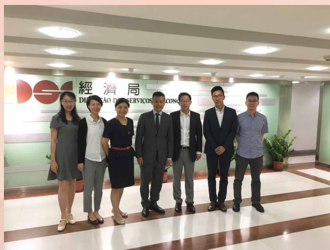
Os representantes da Autoridade de Qianhai e da Fundação de Beneficência de China Merchants Group visitaram DSE

empreendedorismo juvenil na Grande Baía Guangdong-Hong Kong-Macau. Depois do encontro, a comitiva de Shenzhen visitou o Centro de Incubação de Negócios para os Jovens de Macau, que fica situado no Edifício The Carat.