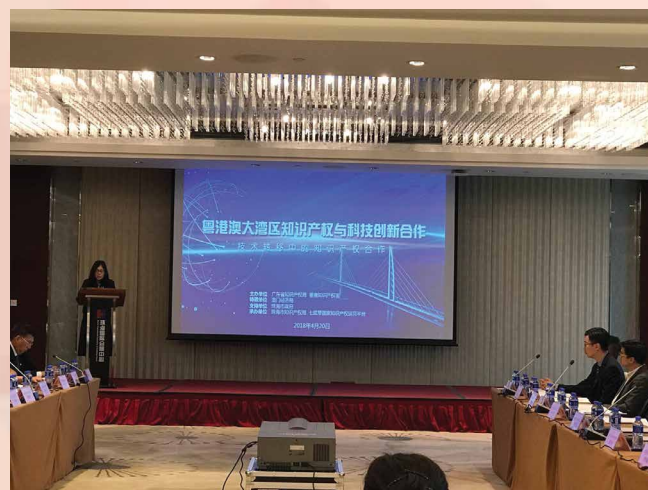
Intercâmbio intitulado “Cooperação na Propriedade Intelectual e Inovação Tecnológica da Grande Baía Guangdong-Hong Kong-Macau

cooperação entre Guangdong, Hong Kong e Macau são cada vez mais activas, promovendo o desenvolvimento sinérgico da economia das três regiões mediante o apoio dos resultados tecnológicos. Depois da actividade, os representantes visitaram a plataforma de aplicação e operação da propriedade intelectual do Estado (Qi Xianqin), tendo maior compreensão sobre a situação operacional desta plataforma, estrutura dos negócios, bem como a tendência do futuro desenvolvimento.