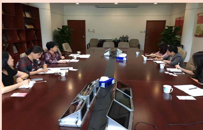
Reunião com a Comissão da Economia, Comércio e Informatização de Shenzhen

Com vista a concretizar as construções da Grande Baía Guangdong-Hong Kong-Macau e promover a participação nos respectivos trabalhos, bem como para intensificar a cooperação e intercâmbio entre a Direcção dos Serviços de Economia e as entidades locais da Grande Baía responsáveis pelos assuntos comerciais, a comitiva da DSE efectuou uma visita a nove cidades da Grande Baía Guangdong-Hong Kong-Macau, tendo encontros com os