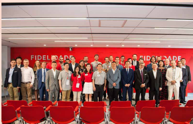
O Secretário para a Economia e Finanças esteve presente na sessão de encerramento do Bootcamp do Protechtng

No sentido de concretizar o papel de Macau como Plataforma de Serviços para a Cooperação Comercial entre a China e os Países de Língua Portuguesa e continuar a promover o trabalho para a construção do Centro de Intercâmbio e Inovação e do Empreendedorismo para Jovens da China e dos Países de Língua Portuguesa, o Governo da RAEM organizou uma delegação empresarial de Macau para realizar, nos dias 19 a 29 de Junho de 2018, uma visita a