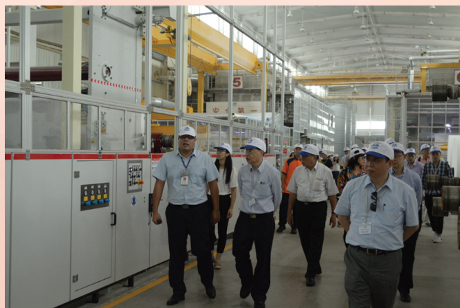
澳門企業代表團訪問江門製造業