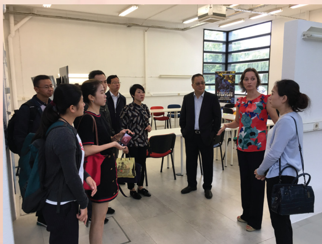
交流團參觀孵化機構 Fábrica de Startups

“中葡青年創新創業交流計劃”作為特區政府“青年灣區創業創新計劃”的其中一個項目，本年8月1日起已增加開放予大灣區內與澳門簽訂合作協議的青創孵化基地，由其推薦會員向經濟局申請使用葡萄牙的相關設施及服務，以促進內地、澳門與葡萄牙三地青創人士建立商業聯繫，鼓勵內地青創企業利用澳門作為中葡平台“走出去”尋找商機，並迸發創新思維，帶動三地青創合作的協同效應。