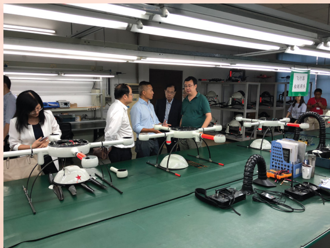
代表團與無人機技術開發中心負責人交流

特區政府一直積極支持澳門製造業升級轉型，重視利用創新科技，努力建設澳門成為智慧城市。佛山作為粵港澳大灣區的先進裝備製造業基地，先進的智能製造為本澳製造業界提供具豐富而實質的參考價值。為此，經濟局於8月30及31日率領澳門工商界企業一行約三十人到訪佛山市，參觀高新科技園區、創新技術應用的重點產業以及與當地企業協會進行交流對接。