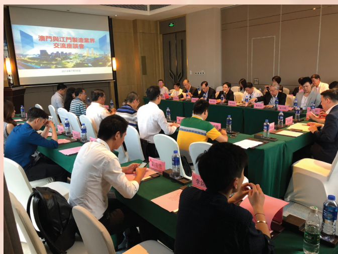
澳門及江門市兩地企業進行交流座談

製造業作為澳門經濟發展的支柱產業之一，其技術支撐和產業基礎是推動澳門經濟適度多元不可或缺的部份。面對新時代區域發展新格局，粵港澳大灣區的建設為澳門深化區域合作，融入國家發展大局提供了重大機遇。