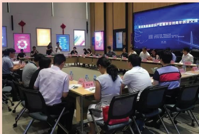
參會代表於座談會上進行交流

業谷參觀，瞭解橫琴地區的規劃建設及創新創業環境，並與珠海企業代表座談分享各自創新創業經驗。