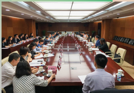
CEPA貨物貿易升級版第二輪高官會

《CEPA貨物貿易協議》磋商工作於2018年3月正式啟動，經過兩次高官會與多輪技術性磋商，雙方已就協議文本框架和內容基本達成共識，預計《CEPA貨物貿易協議》將於年底前簽署。CEPA貨物貿易的升級將有助促進兩地貨物貿易發展，為澳門經濟適度多元增添動力，協助澳門業界融入國家發展大局，推動澳門經濟適度多元發展。