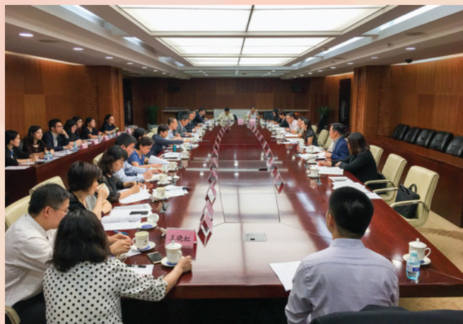
CEPA貨物貿易升級版第二輪高官會在北京舉行

藉着CEPA貨物貿易的升級，進一步加強雙方交流合作水平、促進兩地貨物貿易的發展，協助澳門業界更深入地融入國家發展大局，推動澳門經濟適度多元化發展。同時，把握粵港澳大灣區建設帶來的新機遇，為兩地貿易便利化方面取得新的突破。