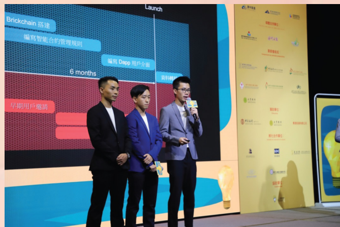
參賽者在項目路演中展現實力

下一階段，各組別的冠亞季軍及獲評審團推薦之團隊，聯同之前報名並經過篩選的企業成長組參賽者，將於稍後赴深圳前海參加“粵港澳青年創客特訓營”及“2018‘招商杯’前海粵港澳青年創新創業大賽半決賽”，與區域創業青年進行同台競賽。另外，符合條件之參賽者將獲邀參展第二十三屆澳門國際貿易投資展覽會。