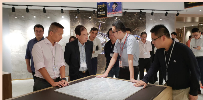
代表團參觀陶瓷製造企業

澳門工商界企業代表團先後參觀由中德合資的無人機技術開發中心和汽車組裝中心、訪問一家由傳統電器生產商發展成為研製機器人與自動化系統及智慧供應鏈的科技集團，聽取企業藉加強與外國高新技術企業合作取得的發展成果。此外，透過參觀佛山著名的傳統製造業，包括陶瓷、紡織及傢俱產業，代表團深入瞭解企業利用科技創新技術與製造業深度融合，全面推進產業優化升級。