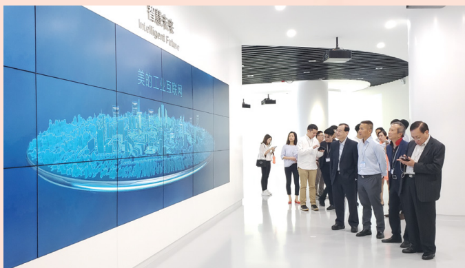
著名家電企業展示其最新科技和創新產品

新及產業升級轉型的信心，長遠助力澳門經濟適度多元可持續發展。同時，佛山工商企業希望能透過澳門作為中國與葡語國家商貿合作服務平台的優勢“走出去”，開拓葡語系國家等國際化市場。雙方並期望能建立長期緊密合作關係，加大兩地經貿合作空間，實踐優勢互