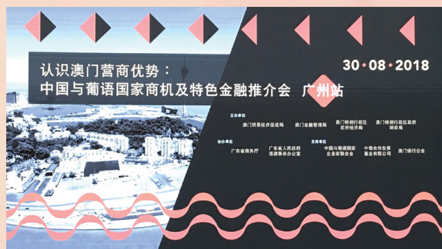
認識澳門營商優勢：中國與葡語國家商機及特色金融推介會

珠海及中山舉行，推介活動能讓當地企業了解澳門的投資環境、特色金融發展、澳門稅制及中葡基金協助企業走出去的功能，加深大灣區城市內的企業、金融機構及市民對澳門中葡平台服務的認識。