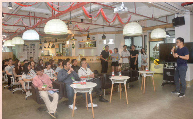
青年雙創培育計劃學習交流團在珠海金嘉創意谷進行座談交流

“青年創業創新培育計劃”今年已進入第三屆，結合過往的經驗，今屆透過實地參訪交流，期望讓學員及本地青創人士親身接觸到粵港澳大灣區的發展環境，拓闊視野及積累人生經驗，為日後創業帶來助推力。