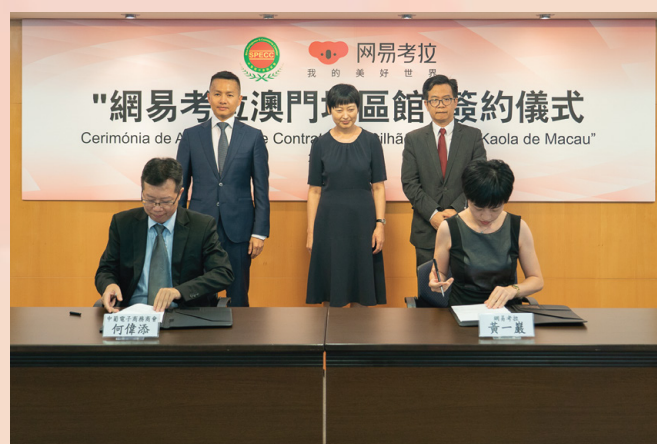
中葡電子商務商會與網易考拉簽署設立“澳門地區館”戰略合作備忘錄

提升產品知名度及銷量。網易考拉澳門地區館的設立，成功踏出了在內地大型電商平台設立澳門地區館的第一步，未來經濟局將積極推動商會在更多的電商平台設立澳門地區館，進一步擴闊澳門企業的線上銷售渠道。