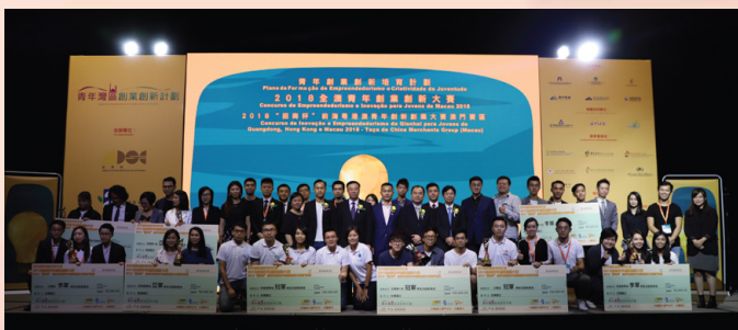
全澳青年創業創新大賽頒獎禮

由經濟局、教育暨青年局及青年創業創新培育籌備委員會合辦的“2018全澳青年創業創新大賽”（2018“招商杯”前海粵港澳青年創新創業大賽澳門賽區）決賽於2018年9月22日順利舉行，並於同日頒發“初鳥尋夢組”、“公開組”和“互聯網+組”三個組別的冠、亞、季軍獎項。