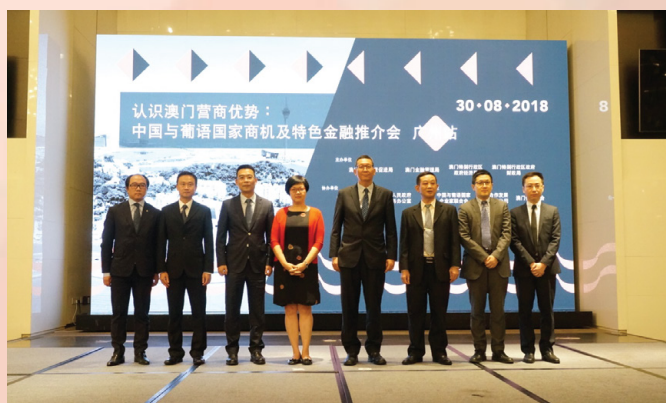
推介會主辦、協辦單位合照

為落實國家支持澳門構建“中國與葡語國家商貿合作服務平台”之舉措，澳門貿易投資促進局、澳門金融管理局、經濟局及財政局共同主辦“認識澳門營商優勢：中國與葡語國家商機及特色金融推介會”，向粵港澳大灣區城市推介澳門營商環境及中葡平台特色金融商機。活動分為四站，先後分別在廣州、江門、