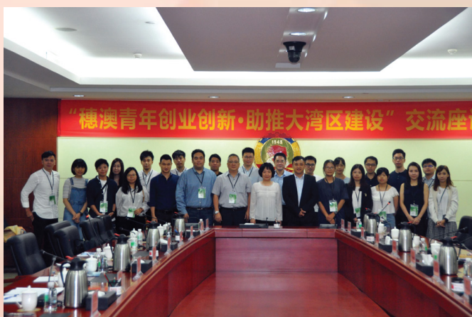
南沙區政協及各部門領導與交流團一行合影

為支持本地青年創業創新發展，推動澳門青年融入粵港澳大灣區的建設和發展，由經濟局、教育暨青年局及青年創業創新培育籌委會主辦的“青年創業創新培育計劃”之“初鳥成長篇”內地學習交流團，於2018年7月26日至28日順利舉行，活動組織了24名澳門青年團體代表及培育計劃學員共同參與。