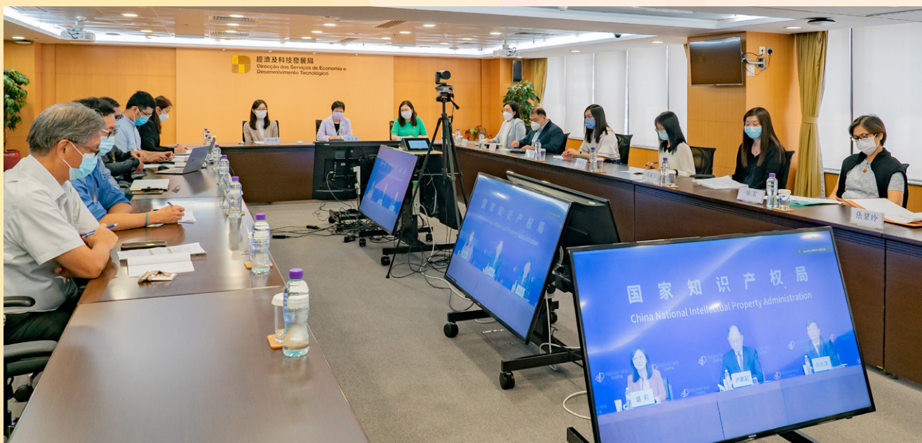
“2022年內地與香港特區、澳門特區知識產權研討會”以線上形式舉行

研討會圍繞“內地與港澳知識產權的最新發展”及“商標保護與品牌建設”兩個主題展開討論，由三地知識產權行政管理部門的代表分別介紹內地及港澳特區知識產權的最新情況和發展趨勢，並邀請了三地企業代表擔任主講嘉賓，共同探討商標保護對企業發展的重要性，以及分享運用品牌策略推動企業建設創新的心得與經驗。