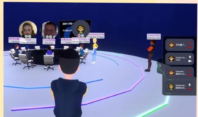
巴葡企業與內地投資者進行商業對接洽談

除路演專場外，在 BEYOND EXPO 展會期間，經科局亦設立了“中葡科技交流合作展示區”，介紹經科局在推動中葡科技交流合作上已開展的工作，充分利用展會平台宣傳澳門國際科技合作的現況。