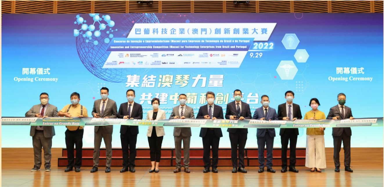
2022巴葡科技企業（澳門）創新創業大賽於9月29日舉行

為推動中葡科技交流合作，助力大灣區構建國際化的科技創新走廊，由經濟及科技發展局主辦的第二屆“巴葡科技企業（澳門）創新創業大賽”決賽於2022年9月29日順利舉行，並於同日頒發了冠、亞、季軍、“最具灣區發展潛力獎”和“最具科技價值轉移獎”五個獎項。