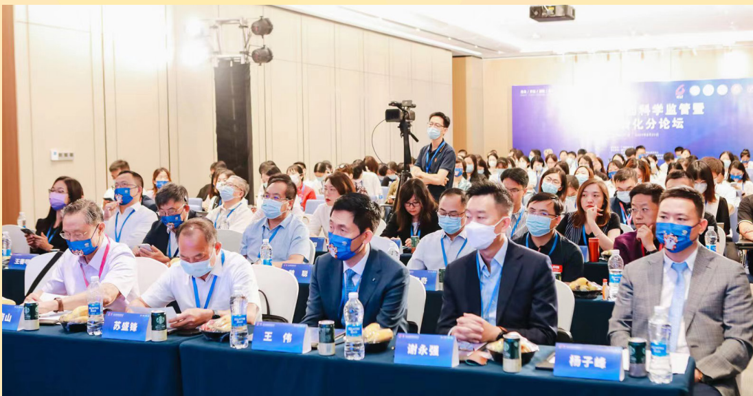
經科局派員赴穗參加國際絡病學大會中醫藥產業分論壇

會上，鍾院士分享了他作為科研人員在醫藥轉化的寶貴經驗及對大灣區中醫藥發展的期許，鼓勵澳門加快推動中醫藥的創新發展，充分利用自身優勢，積極完善中醫藥監管及審評審批的制度，著眼將中醫藥發展至