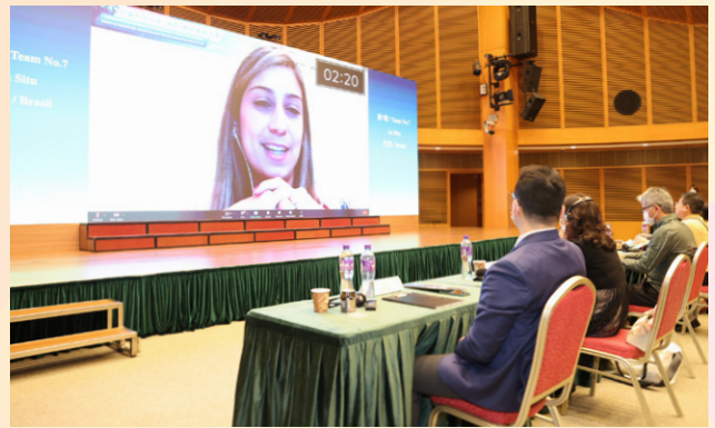
巴葡參賽隊伍線上回應評委提問

因受疫情影響，勝出的巴葡隊伍未能親身到澳琴及大灣區交流及了解狀況。經科局將安排隊伍與內地相關企業進行對接，協助優秀的巴葡科企在灣區取得所需的發展資源，吸引科企落地澳琴及大灣區，推動中葡創新創業及科技合作上的聯動。