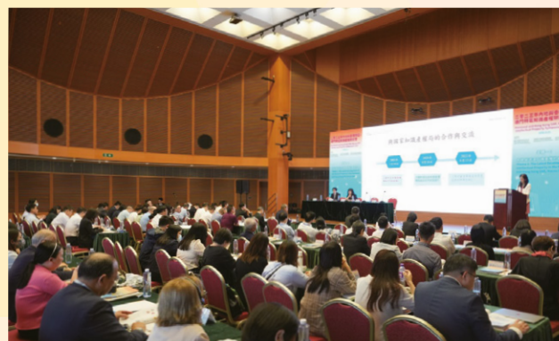
Simpósio sobre a Propriedade Intelectual entre o Interior da China, a RAEHK e a RAEM 2023

promoção do desenvolvimento de alta qualidade, foram analisados, primordialmente, a protecção, a operação e a utilização da propriedade intelectual em diferentes fases da inovação tecnológica e, ao mesmo tempo, tendo ainda sido feita uma abordagem aprofundada sobre a importância da protecção da marca comercial no desenvolvimento da marca corporativa. O simpósio contou com a presença de cerca de 200 participantes, incluindo oficiais governamentais, especialistas, académicos e representantes empresariais no domínio da propriedade intelectual do Interior da China, da RAEHK e da RAEM.