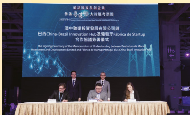
As incubadoras de inovação tecnológica de Macau, de Portugal e do Brasil assinaram acordos de cooperação durante o evento

Durante os roadshows, os responsáveis das 10 empresas de inovação tecnológica do Brasil e de Portugal explicaram aos participantes os destaques da inovação e as direcções do desenvolvimento dos projectos. Alguns projectos baseiam-se num posicionamento claro no mercado, com valor no mercado, casos de sucesso, patentes tecnológicas, etc., que foram bem recebidos por parte dos especialistas e investidores presentes, considerando-se esses projectos maduros e com conteúdo tecnológico, e foram incentivados em apurar melhor as necessidades das indústrias de Macau e da Grande Baía, procurando assim, pontos de partida. No decurso do evento, foram assinados vários acordos de cooperação, respectivamente entre as duas incubadoras do Brasil e de Portugal e a incubadora de Macau, e entre uma empresa de inovação tecnológica de Portugal e uma instituição de ensino superior de Macau. As empresas participantes consideraram a eficácia do evento, estando confiantes na exploração do mercado do Interior da China, e esperaram em obter mais informações durante a visita.