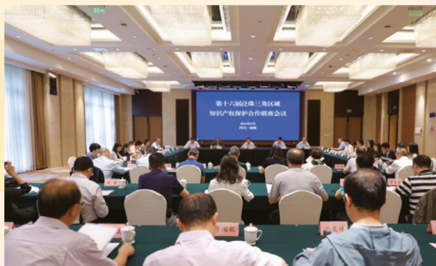
16.ª Conferência Conjunta sobre a Cooperação Regional do Pan-Delta do Rio das Pérolas na Área da Propriedade Intelectual

quadros no exterior, a melhoria do sistema de serviço relativo à propriedade intelectual, o fortalecimento do compartilhamento de recursos de informação sobre a protecção da propriedade intelectual na região.