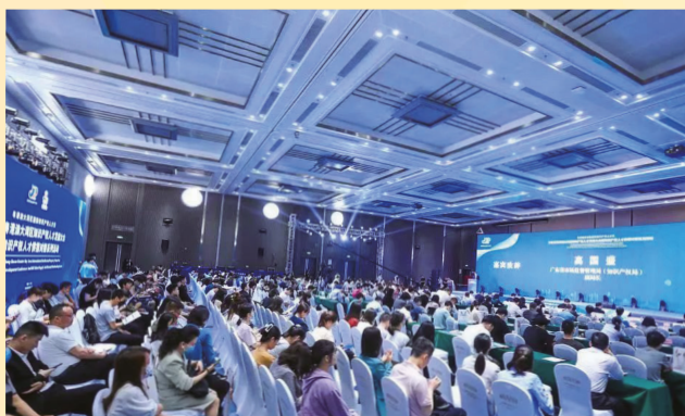
Cerimónia de inauguração da “3.ª Conferência sobre Desenvolvimento de Talentos na Área da Propriedade Intelectual da Grande Baía Guangdong-Hong Kong-Macau e série de actividades de bolsas de contacto (articulação entre a oferta e a procura de talentos na área da propriedade intelectual)”

Organizadas conjuntamente pela Administração de Regulação do Mercado da Província de Guangdong, pelo Departamento da Propriedade Intelectual do Governo da RAEHK e pela Direcção dos Serviços de Economia e Desenvolvimento Tecnológico do Governo da RAEM, a “3.ª Conferência sobre Desenvolvimento de Talentos na Área da Propriedade Intelectual da Grande Baía Guangdong-Hong Kong-Macau e série de actividades de bolsas de contactos (articulação entre a oferta e a procura de talentos na área da propriedade intelectual)” teve lugar, na Knowledge City Plaza, em Guangzhou, no dia 21 de Abril do corrente ano, com a participação de aproximadamente 400 representantes das entidades organizadoras, serviços administrativos da propriedade intelectual, instituições de ensino superior, institutos de investigação científica, empresas e organismos de serviços de propriedade intelectual.