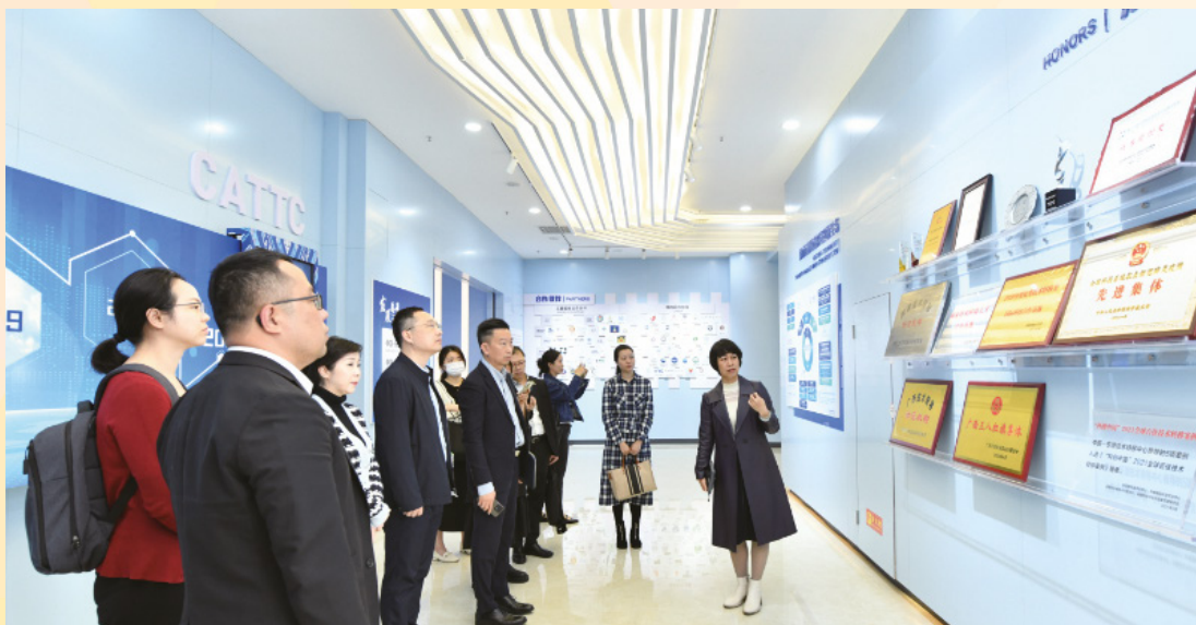
A delegação visitou o Centro de Transferência de Tecnologia China-ASEAN em Nanning, Guangxi