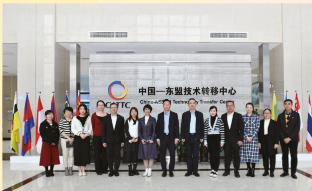
Foto de grupo com os representantes do Centro de Transferência de Tecnologia China-ASEAN