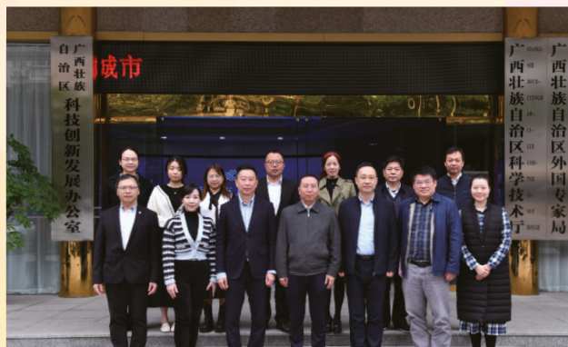
Foto de grupo com os representantes do Departamento de Ciência e Tecnologia da Região Autónoma da Etnia Zhuang de Guangxi

Primeiro, a delegação foi para o Departamento de Ciência e Tecnologia de Guangxi para conhecer a experiência obtida nos intercâmbios e cooperações desenvolvidas entre Guangxi e a ASEAN em várias áreas como a transferência de tecnologia, a construção de uma plataforma inovadora e um laboratório conjunto, a introdução e a formação de quadros da área de ciência e tecnologia. Seguidamente, a delegação dirigiu-se à Universidade de Medicina Chinesa de Guangxi para trocar e conhecer mais sobre a situação de desenvolvimento desta universidade na área da medicina tradicional chinesa. O Centro China-ASEAN, como o foco do evento, foi a última localidade deste intercâmbio organizado pela DSEDT, sendo, até agora, o único organismo nacional de transferência de tecnologia