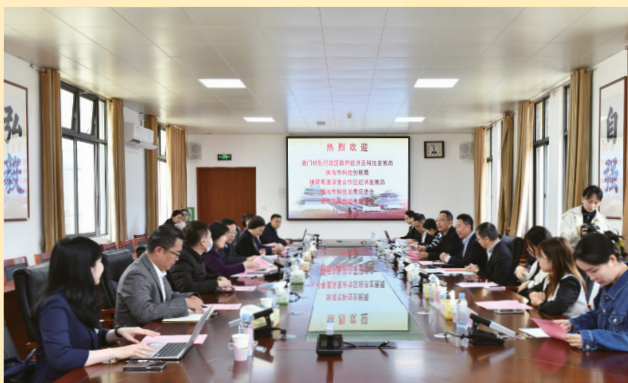
A delegação visitou a Universidade de Medicina Chinesa de Guangxi para trocar informação sobre a situação inovadora em medicina tradicional chinesa

Através deste intercâmbio de trabalho, a DSEDT compreendeu de forma mais profunda as posições e funções do Interior da China e da ASEAN em transferência e transformação dos resultados a nível científico e tecnológico, as quais revestem-se de boas demonstrações e referências para o ordenamento e o funcionamento dos dois centros situados respectivamente em Macau e Hengqin, subordinados ao Centro de Intercâmbio