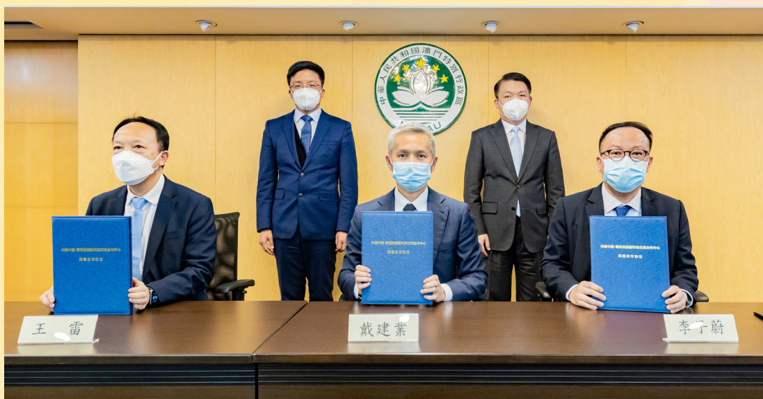
Testemunhado pelos dirigentes de Macau e Zhuhai, os representantes das três partes (Macau, Zhuhai e Hengqin) assinaram conjuntamente o “Acordo de Cooperação Estratégica para a Construção Conjunta do Centro de Intercâmbio e Cooperação em Ciência e Tecnologia entre a China e os Países da Língua Portuguesa”