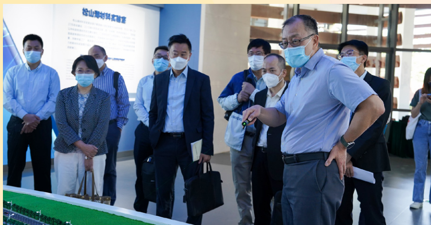
A delegação de representantes visitou o laboratório de materiais situado no Largo Songshan de Dongguan

Durante as diversas reuniões de trabalho, ambas as partes expressaram a vontade de fortalecer a cooperação, discutindo ainda algumas direcções possíveis de trabalho, e com a base existente, explorar e expandir mais projectos de cooperação entre as instituições de Macau e Dongguan, aproveitando ainda mais o papel de Macau enquanto uma janela de intercâmbio internacional para exploração de novos modelos internacionais de pesquisa científica e intercâmbio industrial, no sentido de promover o desenvolvimento da indústria científica e tecnológica na Grande Baía.