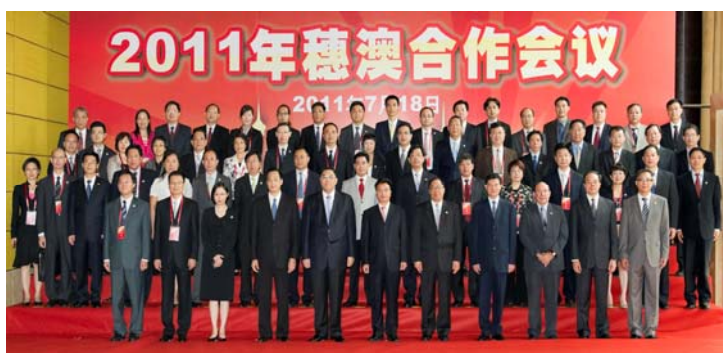
Foto de grupo das autoridades das partes de Guangdong e Macau

No âmbito do Acordo-Quadro de Cooperação Guangdong-Macau, foi criado, formalmente, um grupo de trabalho para a cooperação entre Cantão-Macau, empenhado na promoção de cooperação nas áreas económica-comercial, de convenções e exposições, turismo, tecnologia científica, educação, cultura, entre outras, e impulso conjunto na construção da área de demonstração global do projecto-piloto do CEPA em Nansha, através de cooperação e de consultas periódicas. Decorreu, em 18 de Julho, a reunião de cooperação Cantão-Macau 2011, na zona de Nansha da cidade de Cantão, na qual as duas partes abordaram as prioridades da próxima fase dos trabalhos desenvolvidos no âmbito da cooperação bilateral, tendo ainda afirmado Nansha, como plataforma e meio importante, para a concretização dos objectivos traçados e de oportunidades para um desenvolvimento económico e integração regional.