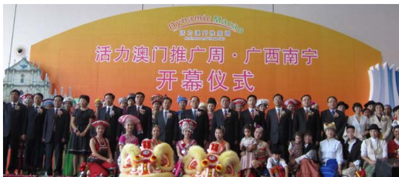
Convidados presentes na cerimónia de inauguração

Realizou-se, com sucesso, da “Semana de Promoção Dinâmica de Macau”, com a duração de três dias (16, 17 e 18 de Setembro de 2011), na cidade de Nanning, na região autónoma de Guangxi Zhuang. Nanning é a base permanente da Feira China-ASEAN constituindo, no âmbito da ASEAN, um mercado enorme, proporcionando inúmeras oportunidades de