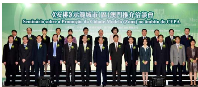
Foto de grupo com os convidados

No decurso do Seminário, foram apresentadas, em vídeo, as mais recentes informações comerciais das 13 cidades e, realizadas sessões de discussão interactiva sobre o ambiente de investimento de cada cidade e sobre a implementação do CEPA, foram instalados stands de exposição das cidades acima mencionadas, para facultar uma plataforma de intercâmbio para diferentes sectores do Interior da China e Macau, permitindo os empresários procurar locais de investimento e parcerias comerciais mais adequados para a sua actividade. No Seminário, foram celebrados dois acordos de cooperação. O Departamento Comércio Externo e de