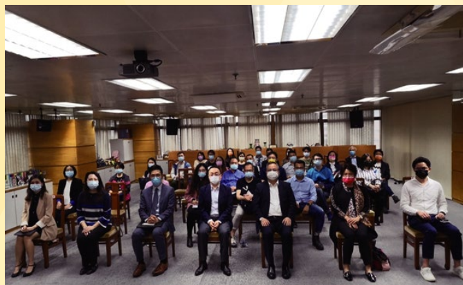
經科局與澳門廠商聯合會合辦工商業界專場講解會，介紹新法規內容。

新法規推出的鼓勵措施更為完善，根據第7/2021號行政法規《鼓勵企業升級發展補貼計劃》，符合資格的投資者，當透過銀行貸款或融資租賃的方式，投資有助澳門經濟發展的項目時，可獲得利息或租金補貼，補貼的期間最長為四年。