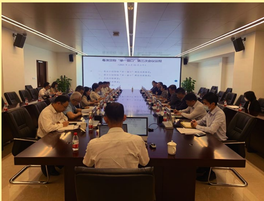
粵澳“單一窗口”第三次工作對接會議於四月下旬舉行

司；澳方包括經濟及科技發展局、澳門海關及統計暨普查局等代表出席。會議期間，雙方作出了工作匯報，尤其在實單測試和貨物編碼轉譯方面取得良好進度，將爭取在短期內完成兩項工作，以積極落實粵澳貨物“單一窗口”的建設工作。