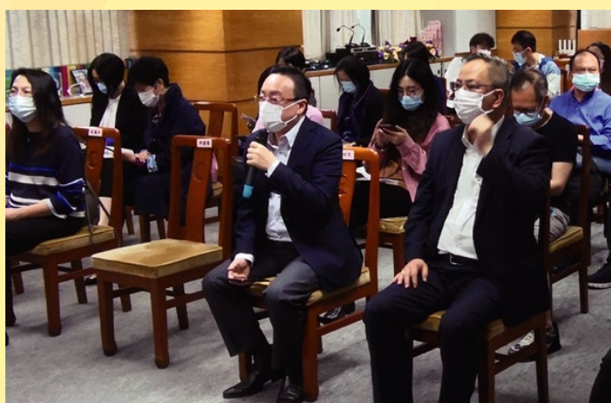
與會企業代表積極提問