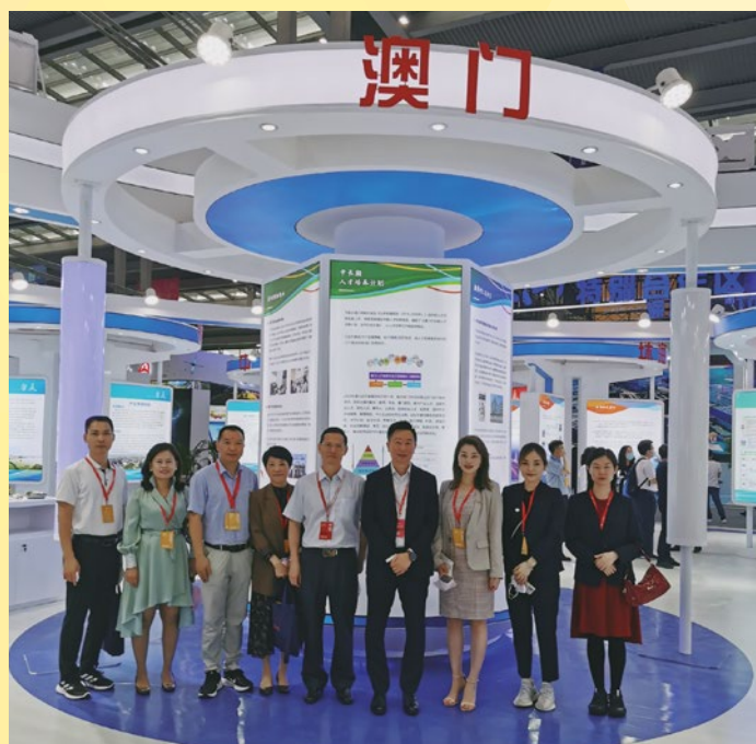
澳門代表與廣東省及珠海市科技相關部門代表在澳門展館前合照