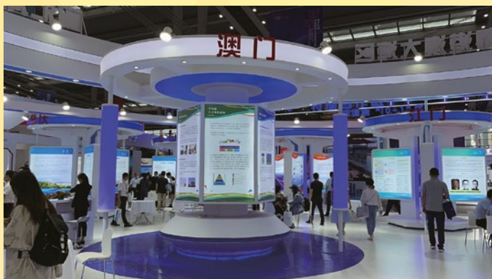
第十九屆國際人才交流大會大灣區展區中澳門展板

未來亦會透過琴澳合作，加強澳門對國際人才的吸引力，推動更多優秀國際人才落戶澳門及大灣區發展。