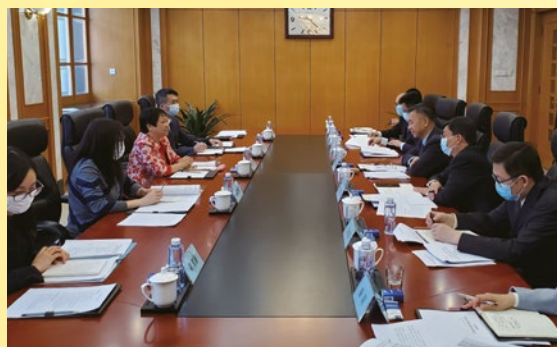
國家知識產權局副局長甘紹寧會見經濟及科技發展局副局長陳子慧一行

此外，經科局一行也到訪了國家知識產權局商標局以及專利審查協作北京中心，瞭解和學習有關商標、專利的智能檢索技術。