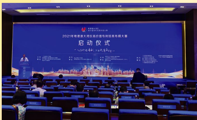
2021年粵港澳大灣區高價值專利培育佈局大賽”現場