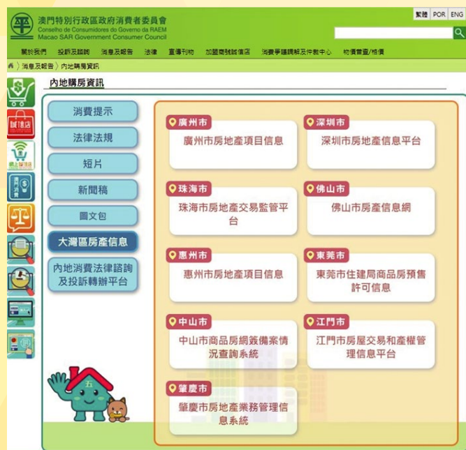
消委會網頁載有大灣區9市的房產交易信息