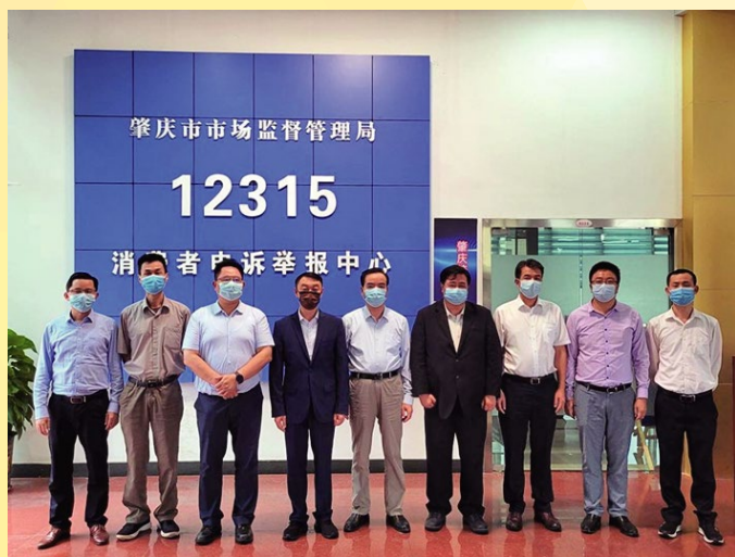
經科局、消委會與肇慶市市場監督管理局、住房和城鄉建設局及消委會舉行會議後合照

訊”專區可供居民核實“五證”證號，查閱發展商、房產坐落位置、分層單位的房屋用途、銷售狀態、單位面積等資料，以及相關房產樓款的監管專用帳戶；讓居民可以更充份掌握計劃購買內地房產的資訊。現時專區已全面與廣州、深圳、珠海、佛山、惠州、東莞、中山、江門及肇慶9個城市監管房產交易信息的網上平台連線。