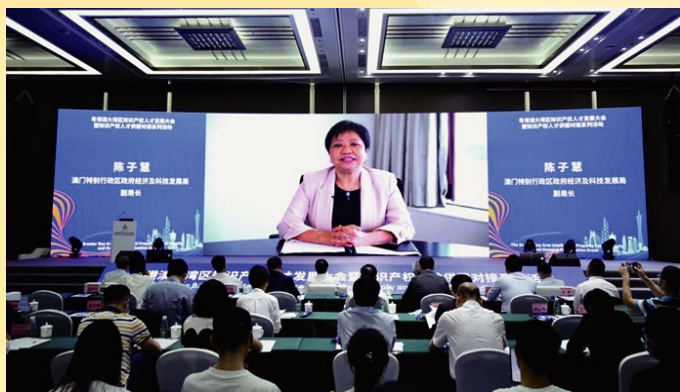
經濟及科技發展局副局長陳子慧在“粵港澳大灣區知識產權人才發展大會暨知識產權人才供需對接系列活動開幕式及專題論壇”上致開幕辭