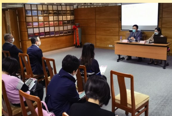
經科局代表詳細解答與會者提問