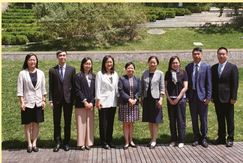
經濟及科技發展局人員到訪國家知識產權局專利審查協作北京中心