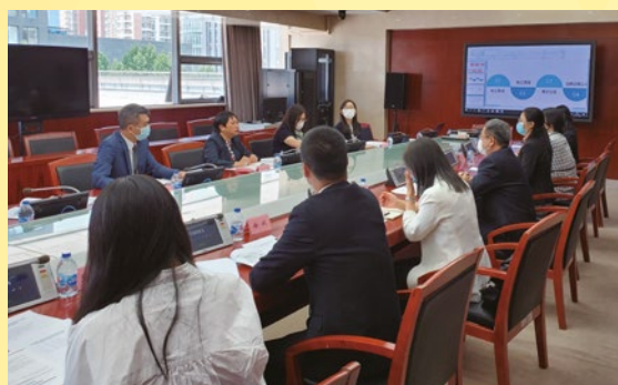
經濟及科技發展局人員與國家知識產權局商標局代表進行工作交流