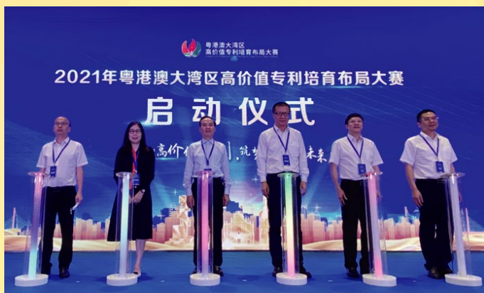
“2021年粵港澳大灣區高價值專利培育佈局大賽”啟動儀式

灣高賽自2019年舉辦以來，累計吸引1,096個參賽項目，成功挖掘並吸引了一批高價值專利項目落戶大灣區，為大灣區經濟的高質量發展提供支撐，推動各類創新資源要素聚集粵港澳大灣區。