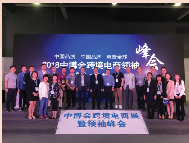
澳门电商业界出席第十五届中博会跨境电商领袖峰会

其后，透过参观中博会跨境电商展内的六大展区，澳门电子商务企业代表团与当地企业进行交流，进一步了解热门的电商营销策略以及实战技巧。澳门企业代表均表示内地的电子