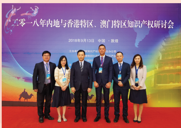
经济局代表出席“二零一八年内地与香港特区、澳门特区知识产权研讨会”

研讨会邀请了三地的知识产权界专家、学者及企业家作为主讲嘉宾，围绕“知识产权：推动创新、增长与繁荣”主题，分别就“知识产权保护支撑创新发展”、“加强知识产权运用，实现知识产权价值”及“加强知识产权服务，支持企业‘走出去’”等三个议题展开深入探讨与交流，从多角度展示了现代知识产权发展的新领域和新特点，提出许多有价值的观点和意见，启发了知识产权事业发展的方向和思路。三地知识产权工作者透过这个交流平台，相互借鉴和学习彼此的经验，取长补短，既促进了三地之间经验与成果的传播和交流，也加深和增进了彼此在知识产权领域上的相互沟通和了解，同时对企业知识产权意识的建立也起