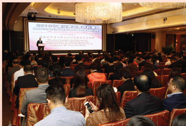
“2018中国投资政策研讨会”顺利举行

制改革、开拓第三方市场及境外经贸合作区、以及CEPA的落实情况与推进等议题进行了专题探讨，并解答业界关注的提问，加深澳门工商界对国家投资政策的了解。