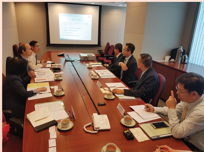
双方就《港澳CEPA》产品安全信息互通进行交流

最后，双方认同是次会面对加深两地监察部门工作的认识达到一定成效，并能具体落实《港澳CEPA》技术性贸易壁垒中涉产品安全领域的合作内容，亦同意今后继续保持交流联系。