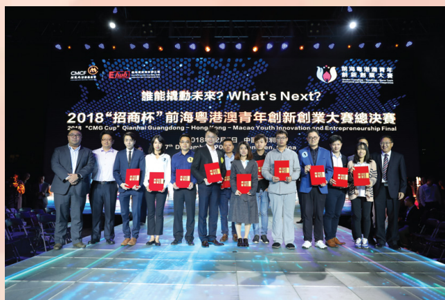
澳门青创参赛团队喜获优胜奖项

为做好支援澳门队伍的备赛工作，在青年创业创新培育筹备委员会的协助下，经济局组织了22人的澳门青创代表团于比赛当天前赴深圳前海，各参赛队伍需进行现场抽签，并为直播作演练。在项目评选环节中，每个团队有7分钟时间向评委展现创业方案，并接受5分钟评审提问；在演说过程中，澳门选手表现流畅自然，备受评审的注意和好评，取得不俗的反映。接续晚上举行的总决赛暨颁奖典礼，各参赛团队利用仅有1分钟的电梯演讲，加上播放团队VCR，争取加分机会，活动过程紧凑吸引；最终澳门参赛团队纳米银柔性触控荣获企业组铜奖，其他项目ADOT壹点广告、Macau Spirit、佳得利现磨现泡、巴打(Brother)维修APP、珍禧均获得优胜奖。