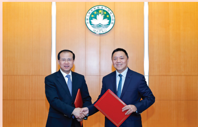
经济财政司梁维特司长和国家商务部傅自应副部长在会议上互换《内地与澳门经贸合作委员会第一次会议纪要》

面自由化。以中葡论坛为依托，充分发挥澳门优势，推进澳门中葡商贸合作服务平台建设，并继续支持澳门参与中国国际进口博览会。