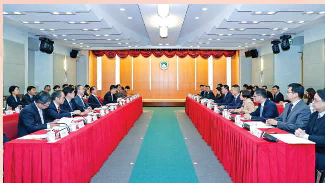
经济财政司梁维特司长和国家商务部傅自应副部长共同主持内地与澳门经贸合作委员会第一次会议

傅自应副部长表示，委员会的成立、CEPA的升级将成为两地经贸交流与合作的新起点，未来将透过委员会机制，在CEPA框架下扩大内地对澳门的开放，在投资、服务贸易领域进一步降低和放宽准入条件，不断提升贸易投资便利化程度，促进两地经济融合。同时，积极支持澳门发挥所长，在经贸领域提出支持澳门参与“一带一路”建设，推进粤港澳大湾区建设的政策措施，推动在大湾区内实现服务贸易全