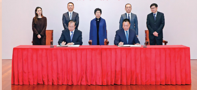
陈海帆代理行政长官等见证经济财政司梁维特司长和国家商务部傅自应代副部长表双方签署《CEPA货物贸易协议》