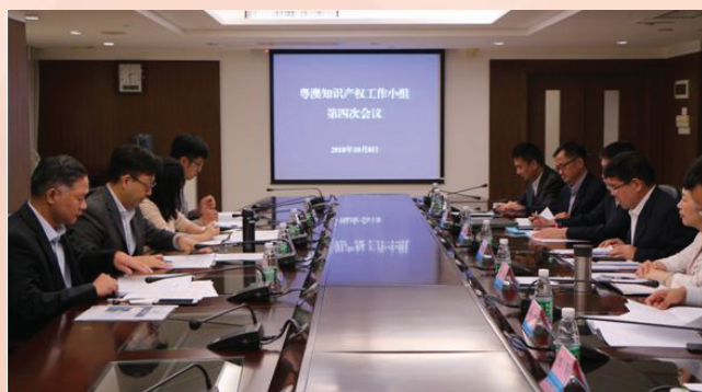
粤澳知识产权工作小组于广州举行第四次会议

工商行政管理局、广东省新闻出版广电局、广东省公安厅、海关总署广东分署；澳方成员包括澳门经济局、澳门海关。