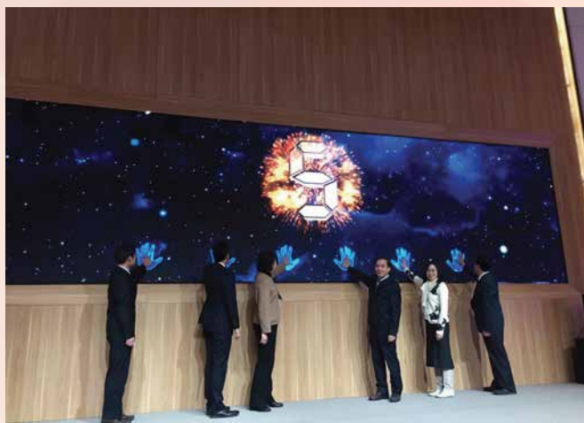
2019年粤港澳大湾区高价值专利培育布局大赛启动仪式

专利创新项目，以点带面增强粤港澳大湾区的创新能力和高价值专利培育布局水平，加快粤港澳大湾区高质量发展。