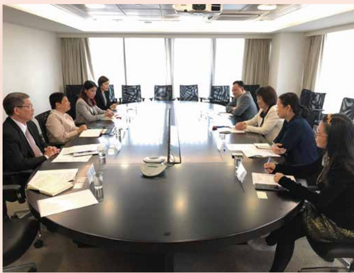
粤澳代表出席在澳举行的“粤澳服务业合作专责小组”工作会议

建立粤澳数据交换机制，深入了解和追踪澳资企业在大湾区的落户情况等，协助澳门企业更好地融入粤港澳大湾区发展。