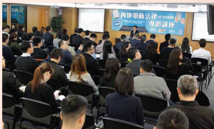
内地电商专家向澳门业界讲解《电子商务法》

会和企业代表参与，与会者在互动问答环节反响热烈，业界代表纷纷就新法实施后可能为企业带来的实际影响提问。活动不但加深业界对跨境电商发展趋势的认识，亦协助澳门中小企开拓内地庞大市场。有兴趣人士可浏览经济局网页或“营商加油站”脸书专页重温讲座的精彩内容。