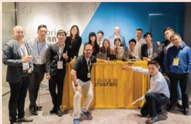
来自本澳的11个青创团队在巴西进行路演