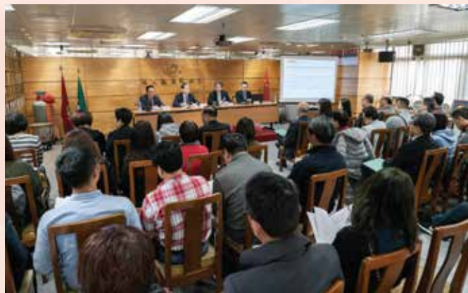
经济局向业界推介《CEPA货物贸易协议》

次讲解会，有助本澳业界更深入了解《CEPA货物贸易协议》的内容和措施，推动更多企业利用CEPA零关税优惠政策把货物出口到内地，为两地货物贸易发展提至新的水平。