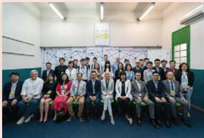
交流团一行参访里约热内卢青创孵化中心Startup Rio

经济局透过组织青创交流活动，加强建立澳门与巴西的商业联系，通过建立沟通机制以进一步巩固“中葡青年创新创业交流中心”的建设，促进两地在经济、贸易、科技、创新创业等多领域的对接，助力澳门青创企业在巴西拓展业务。