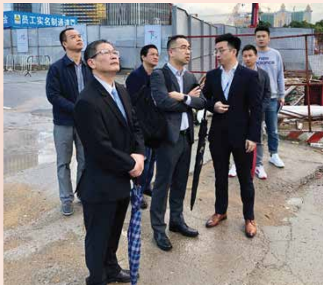
经济局联同业界参观横琴跨境电商配套设施