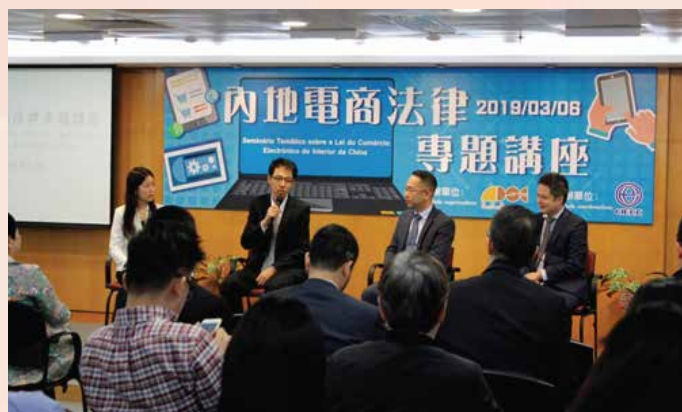
内地电商专家与澳门业界进行交流

会和企业代表参与，与会者在互动问答环节反响热烈，业界代表纷纷就新法实施后可能为企业带来的实际影响提问。活动不但加深业界对跨境电商发展趋势的认识，亦协助澳门中小企开拓内地庞大市场。有兴趣人士可浏览经济局网页或“营商加油站”脸书专页重温讲座的精彩内容。