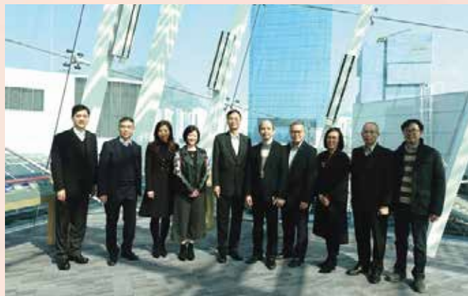
双方就建立产品安全信息互通机制进行交流

双方认同是次会面对加深两地监察部门工作的认识达到一定成效，透过建立合作机制，具体落实《港澳CEPA》技术性贸易壁垒中涉产品安全领域的合作内容，今后亦将继续保持沟通联系。