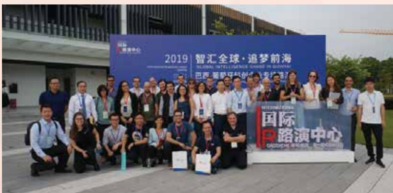
巴葡科创企业在深圳前海顺利进行项目路演