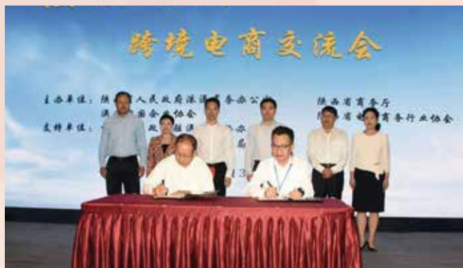
中国企业协会跨境电商专委会与陕西省电子商务行业协会签署战略合作协议

省电子商务行业协会签署战略合作协议，两地企业现场交流对接。澳门中联办王新东秘书长、经济局陈子慧副局长与陕西省人民政府徐大彤副省长及周和斌督查专员等当地嘉宾见证两地企业签署合作协议。