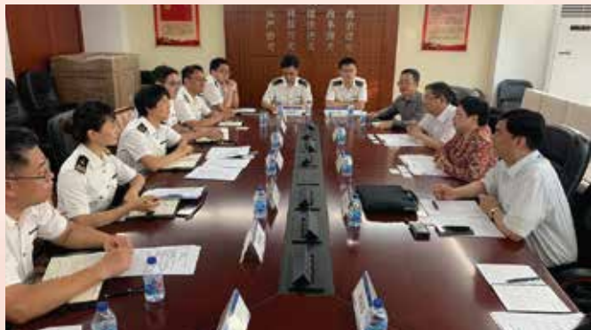
CEPA项下货物贸易协议工作小组会议召开

司长及经济局陈子慧副局长共同主持，双方就原产地规则工作、食品安全监控、通关便利措施及智能海关合作等进行讨论，双方在CEPA框架下就上述议题作充分交流，探索创新的合作试点，以推动便利通关、促进本地制造业发展为目标，争取更开放的优惠措施。