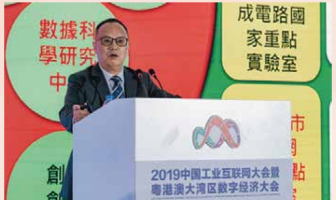
澳门大学宋永华校长发表主题演讲