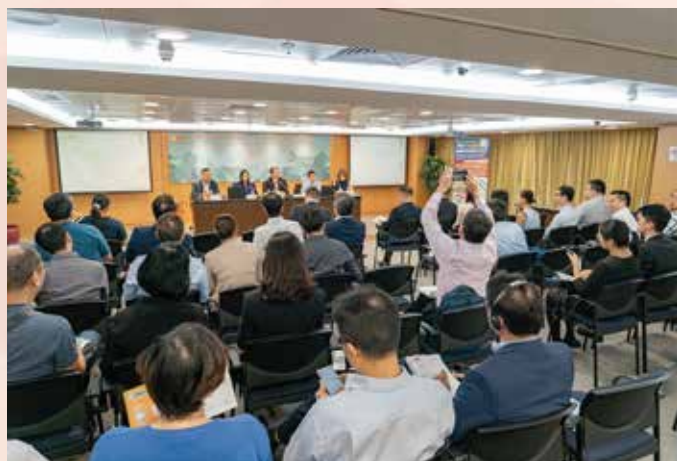
业界代表于讲解会上积极发问

的运作流程、经营要件等各方面资讯，经济局于9月17日举办关于《执行法》的讲解会。讲解会由经济局、海关、邮电局以及澳门电贸代表向业界深入介绍《执行法》的规定，具体内容包括：申领经营准照、进出口准照以及《金伯利进程证书》的流程；经营人的义务以及违法处罚制度；海关申报与清关流程及手续；电子报关EDI的运作流程以及申请及使用电子签名须知。讲解会获业界人士踊跃参与。