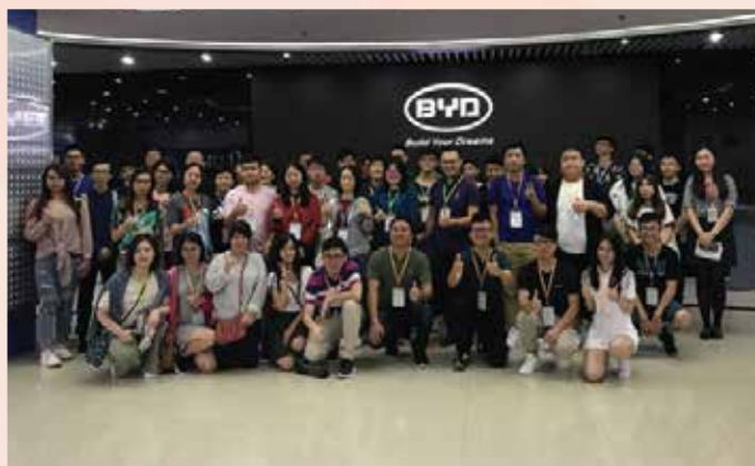
参观位于深圳坪山区比亚迪园区

此同时，为加强青年人对国家现代化发展历程的认识，澳门青年交流团参观了“大潮起珠江 - 广东改革开放40周年展览”，提升青年人的国家意识和爱国精神，更好地融入国家的发展大局。