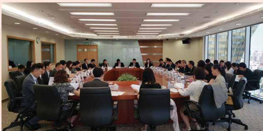
本年度CEPA联合指导委员会第三次高官会议在澳门举行

经济局、澳门金融管理局、澳门贸易投资促进局、法务局、文化局、土地工务运输局、邮电局、高等教育局等多个部门的代表出席了会议。