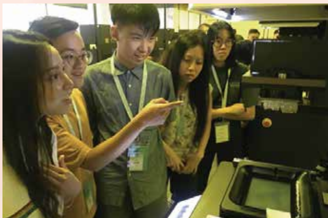
澳门青创代表团参观黄埔高新企业感受前沿科技

建设、金融支持、办公补贴、实习就业、合作交流等各领域，支持港澳青年落户发展，共创美好的发展未来。