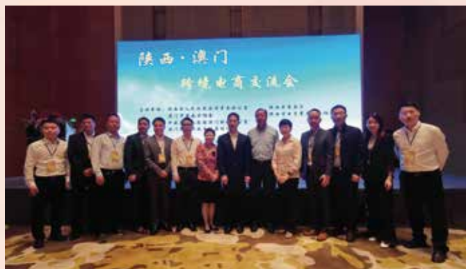
澳门代表团参加陕西澳门跨境电商交流会