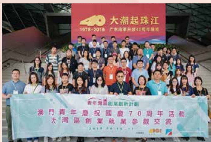
参观大潮起珠江广东改革开放40周年展览