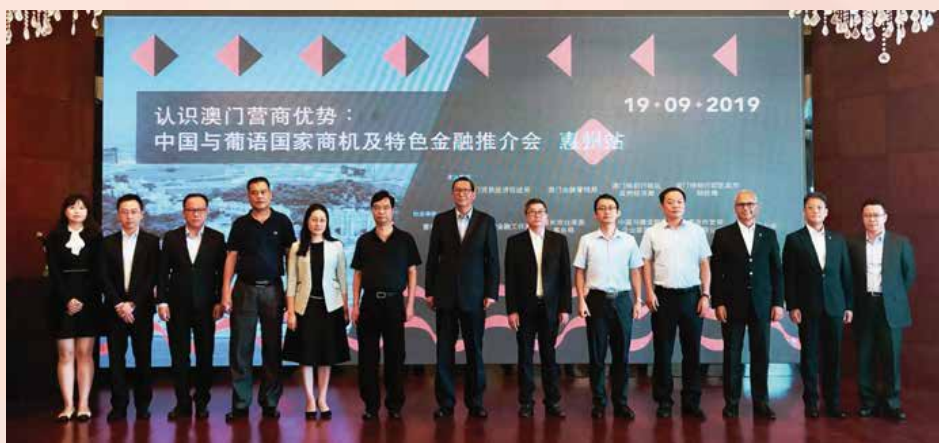
中国与葡语国家商机及特色金融推介会

租赁税务优惠制度》。推介会已完成走访大湾区内地九个城市，并达致预期效果，加深了大湾区城市对澳门认识，尤其是本澳中葡平台及金融发展方面。