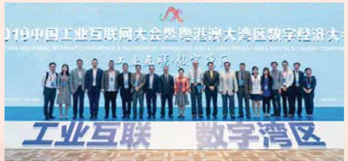
澳门代表团成员于大会会场合照

澳门代表团成员包括：澳门大学、科学技术发展基金、邮电局、澳门生产力暨科技转移中心、澳门厂商联合会、澳门国际科技产业发展协会、澳门智慧城市联盟协会、资讯科技协会及澳门科学技术协进会等，与会代表均认为活动可加深对粤港澳大湾区数字经济发展的认识，了解大数据、人工智能及工业互联网的应用发展，并能促进大湾区内产官学的互动与交流。