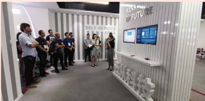
参访从事人脸识别与大数据技术的广州知名科创企业

澳门作为中葡平台的平台功能，引进葡语系国家优质的科技创新项目在大湾区开拓业务，助力国家创新创业发展，更好地融入粤港澳大湾区、“一带一路”等国家重大发展战略。