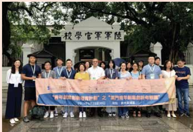
澳门青创代表团参观黄埔军校

活动组织了二十多名澳门青年，到访广州开发区的青创孵化机构及创新型企业，包括国际区块链中心、清华珠三角粤港澳创新中心、生物岛展厅等，感受该区的最新城市规划，启发未来在粤港澳大湾区创业发展的路向。此外，交流团参观了香雪制药股份有限公司、广州黑格智能信息