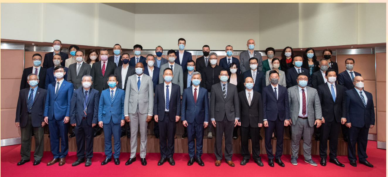
经济及科技发展局举办“中葡科技交流合作”研讨会