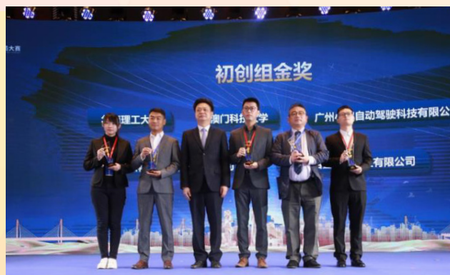
澳门科技大学项目获得发明初创组金奖

经共同筛选和评审，澳门特区7个项目列入分组百强名单，取得复赛资格，其中4个项目闯入分组五十强，进入决赛，最后获得一项金奖二项优秀奖的佳绩。澳门科技大学“一种新型内源性缓释硫化氢供体的研究”项目获得发明初创组金奖，澳门大学“干细胞球软膏治疗糖尿病足”项目和安信通科技（澳门）有限公司“智能车载机器人”项目分别获得发明初创组优秀奖，获奖成绩是历年之冠。