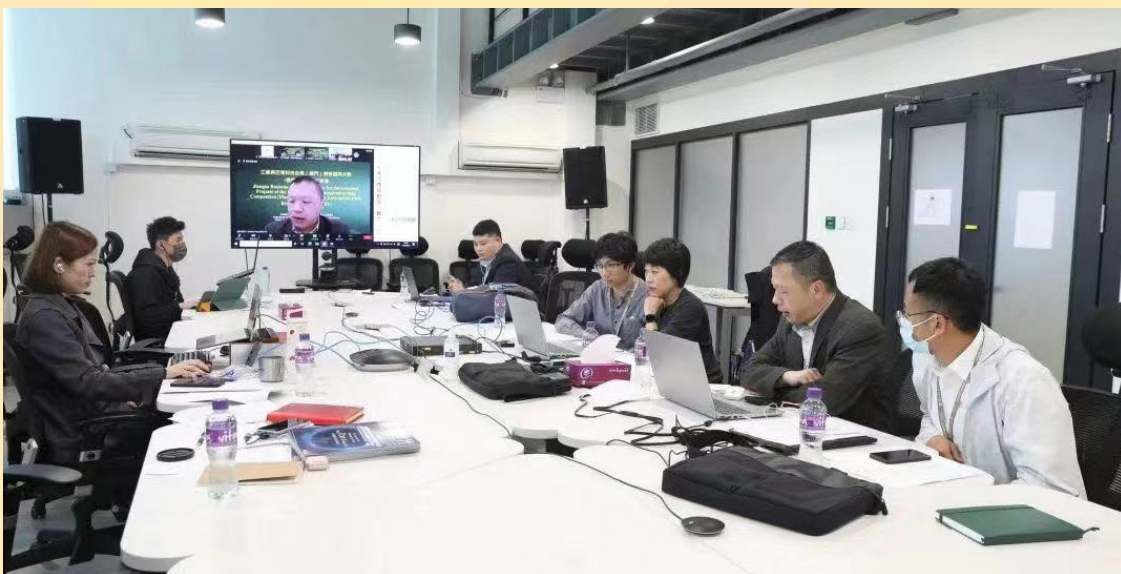
经科局举办巴葡大赛得奖项目与江苏企业对接会