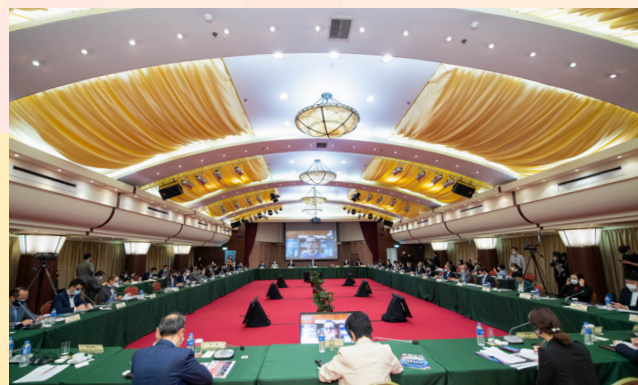
研讨会现场气氛热烈

本次研讨会现场气氛热烈，参会者均表示透过研讨会的互相交流，可更深入认识中葡科技交流合作的内涵，及未来澳门在科技发展的方向及机遇。