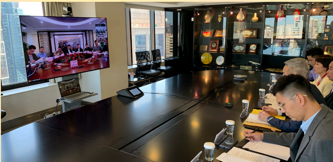
经科局与广州市科技局进行线上会议